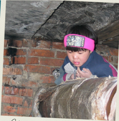
Strassenkinder in der Kanalisation, 2004