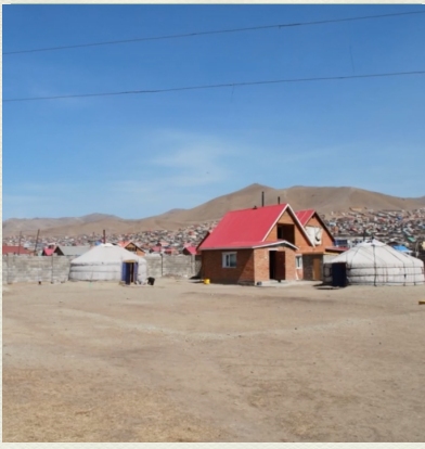
Das neue Grundstück. 2009