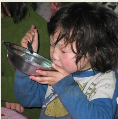
In der Suppenküche